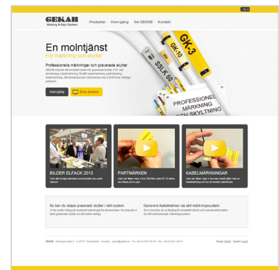
Skapa dina egna sorteringar snabbt och enkelt via internet.

Tänk på att montörtiden med ca. 8 kr/minut, ofta väger tyngre än själva materialkostnaden.